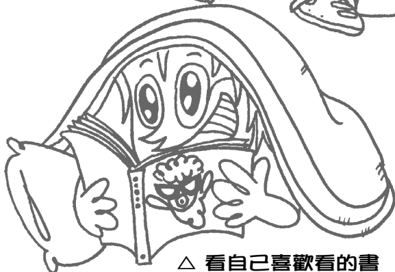
△ 看自己喜歡看的書